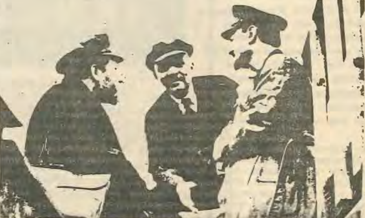
3 μπολσεβίκοι ήγέτες, Τρότσκι, Λένιν, Κάμενεφ.